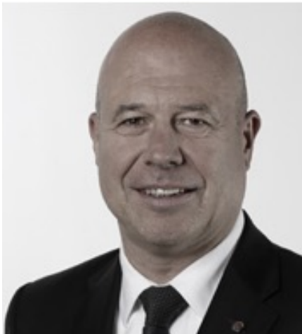
Fabio Regazzi Consigliere agli Stati